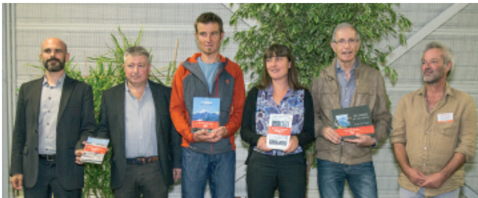
Remise des Prix du Livre Pyrénéen 2018

Les Prix du Livre Pyrénéen ont été créés par l'association Binaros afin de mettre en valeur la production littéraire actuelle concernant les Pyrénées et de développer la visibilité des Pyrénées au-delà de ses frontières grâce à un média de qualité et d'avenir : le livre. L'ambition des Prix du Livre Pyrénéen, à plus long terme, est d'augmenter la création et la qualité littéraire des livres consacrés aux Pyrénées. Tous les prix sont dotés de la même somme, à savoir 750 euros destinés aux auteur-e-s.